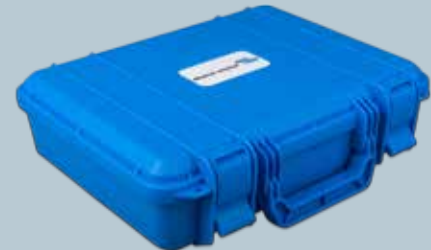
Bärfodral för laddaren och dess tillbehör