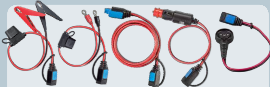
Klämmor med säkring